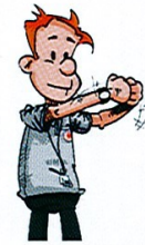
4 CEINTURER, RETENIR OU POUSSER