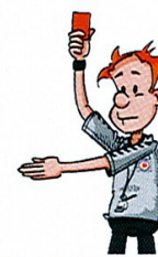
13 DISQUALIFICATION (ROUGE)