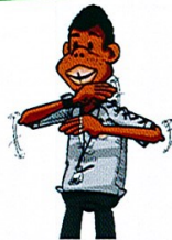
3 MARCHER OU 3 SECONDES