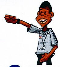
7 REMISE EN JEU DIRECTION