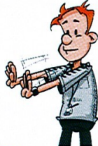
19 NON RESPECT DES 3 MÈTRES