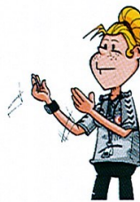
16 AUTORISATION ACCORDÉE À DEUX PERSONNES HABILITÉES DE PÉNÉTRER SUR LE TERRAIN