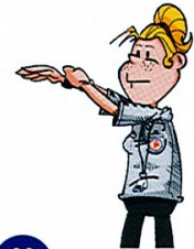
11 JEU PASSIF

EXCEPTIONNELLEMENT utilisé sans être précédé du geste 17 d'avertissement