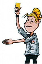
13 AVERTISSEMENT (JAUNE)