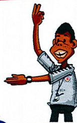
14 EXCLUSION (2 MINUTES)